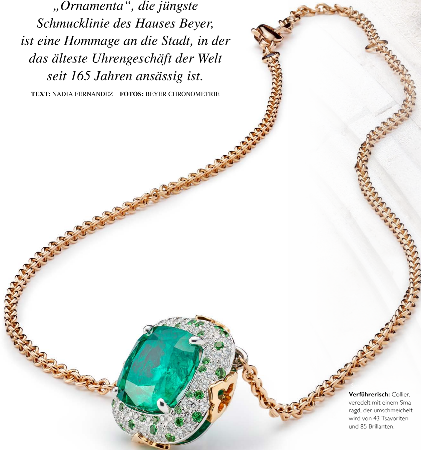
Verführerisch: Collier, veredelt mit einem Smaragd, der umschmeichelt wird von 43 Tsavoriten und 85 Brillanten.

TEXT: NADIA FERNANDEZ