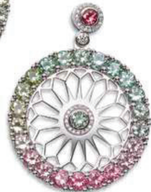
Beyer Ohrhänger Maya 72 Brillanten 0,115 ct. Pavé E/F if-vvs 48 Turmaline 8,6 ct. im Farbverlauf. Weissgold, CHF 23'600