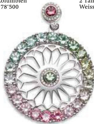
Oben rechts: 55 Tsavolithe 0,81 ct. rund facettiert 17 Turmaline grün 6,4 ct. rund facettiert, Farbverlauf grün 1 Tahitiperle 11-12 mm, Peacock Weissgold 750, CHF 21'300